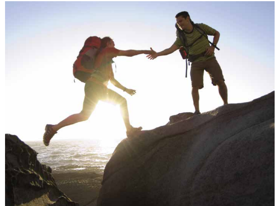
Schließen Sie die Lücke – der Staat und Ihr Arbeitgeber helfen Ihnen dabei!